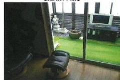
【リビングからのサンデッキ】