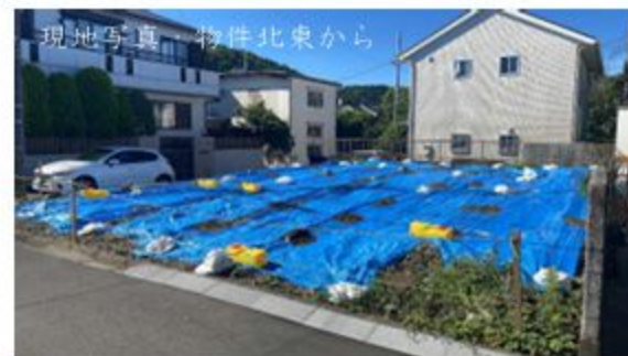
現地写真 物件北東から